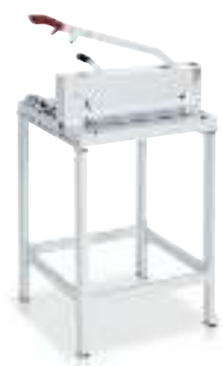
stand en option