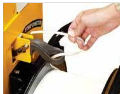
Remplacement facile de la bobine