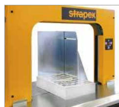
Taquage pour aligner des paquets lâches