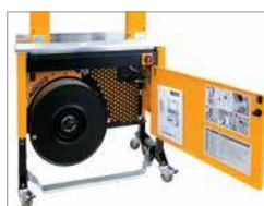
Construction robuste et compacte