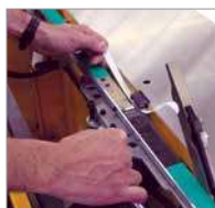
Pas d'outils nécessaires pour la maintenance