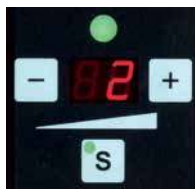
Réglage simple de la tension par bouton-poussoir