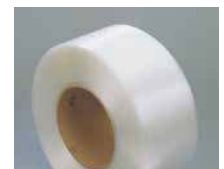
Feuilards économiques pour un cerclage soigneux