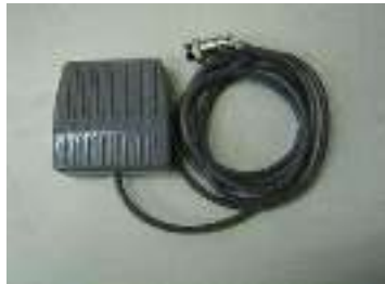
Pédale au pied