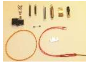
Pièces détachées fournies

Bande plastique et papier en 30 mm x 155 ml