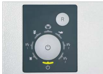
Tableau de commande fonctionnel avec affichage à LED

Le puissant fonctionnement garantit un fonctionnement en continu.