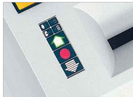
Tableau de commande fonctionnel avec affichage à LED

Le puissant fonctionnement garantit un fonctionnement en continu.